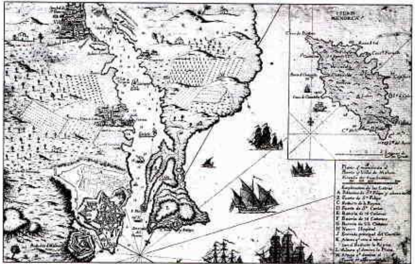
FIGURA 4. MAPA DE LES COSTES DE MENORCA AMB LA PLANTA DEL CASTELL DE SANT FELIP. INICIS DEL SEGLE XIX.

7 A la pràctica les oligarques de Palma controlaven de manera força estreta el govern municipal amb el qual havia de pactar el virrei. En un informe confidencial tramès a Manuel de Sentmenat a l'inici del seu virregnat, s'esmentava concisament el caràcter tancat de les insaculacions. ANC. Marquesos de Casteldosrius (Sentmenat). Fons nº