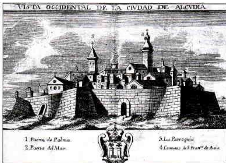
FIGURA 3. VISTA DE LA CIUTAT D'ALCÚDIA. GRAVAT DE PALOMINO IMPRÈS A L'ATLANTE ESPAÑOL, MADRID 1779.